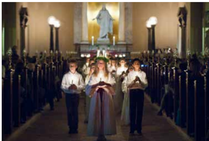
Onsdag 15. december er der luciaoptog og gudstjeneste i Vor Frue Kirke, der får besøg af børn fra Zahles Skoles 4. klasser.