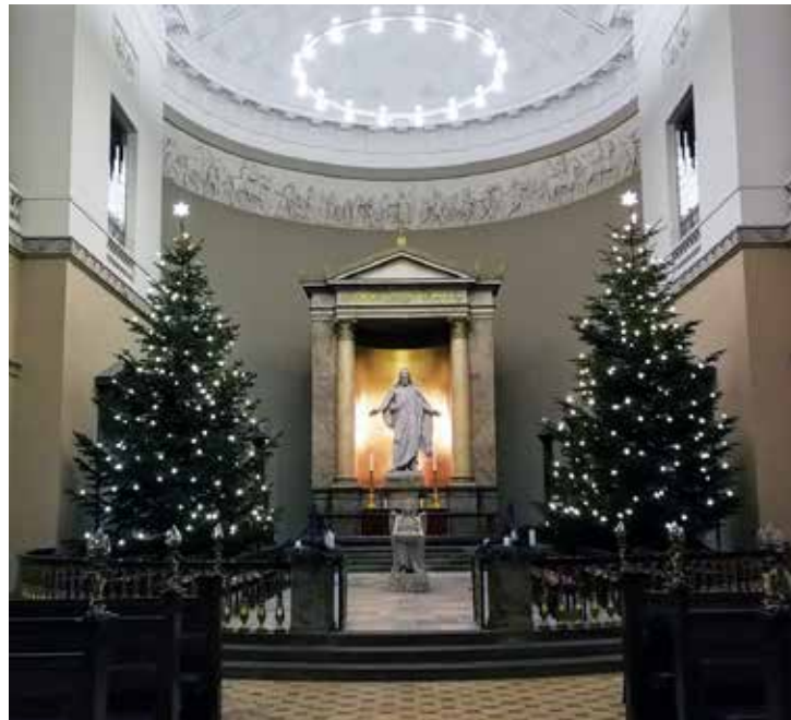
Søndag 24. december kl. 16.30 er der juleaftensgudstjeneste med Hartmanns liturgi.