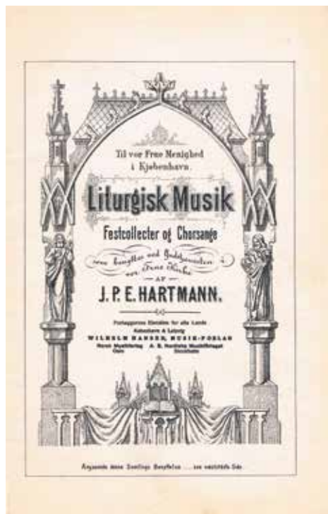
Forsiden til J.P.E. Hartmanns Liturgisk Musik udgivet i 1881

der siden begyndelsen af 1800-tallet havde været talt og skrevet meget om liturgi, liturgisk sang og salmesang. Tiden var inde til at tænke nyt og tænke kritisk. 1