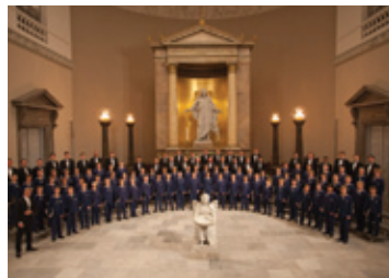
Københavns Drengekor