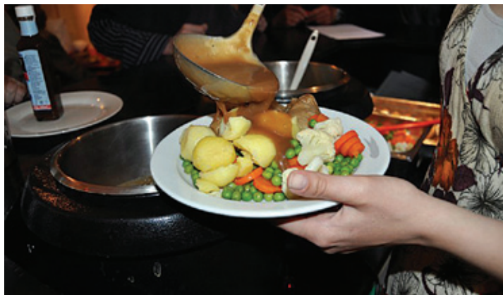
Den sorte Gryde i Nansensgade